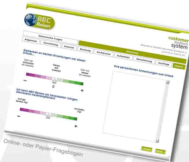
Online- oder Papier-Fragebogen

INVERES.CFS unterstützt Qualitätsmanager und Marktforscher in einem.